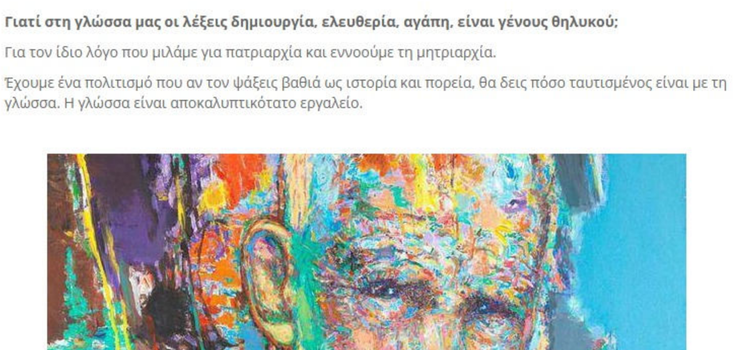
Το πορτρέτο του Γιώργου Σαφέρη

Η τέχνη ως η πρωτογενής τάξη ελευθερίας, δεν διδάσκειται. Διδάσκειται όμως αυτό που αποφύγει για να μην επιβιώσει λάθρα ακυρώνοντας έτσι το ηθικό της πλεονεκτήμα.