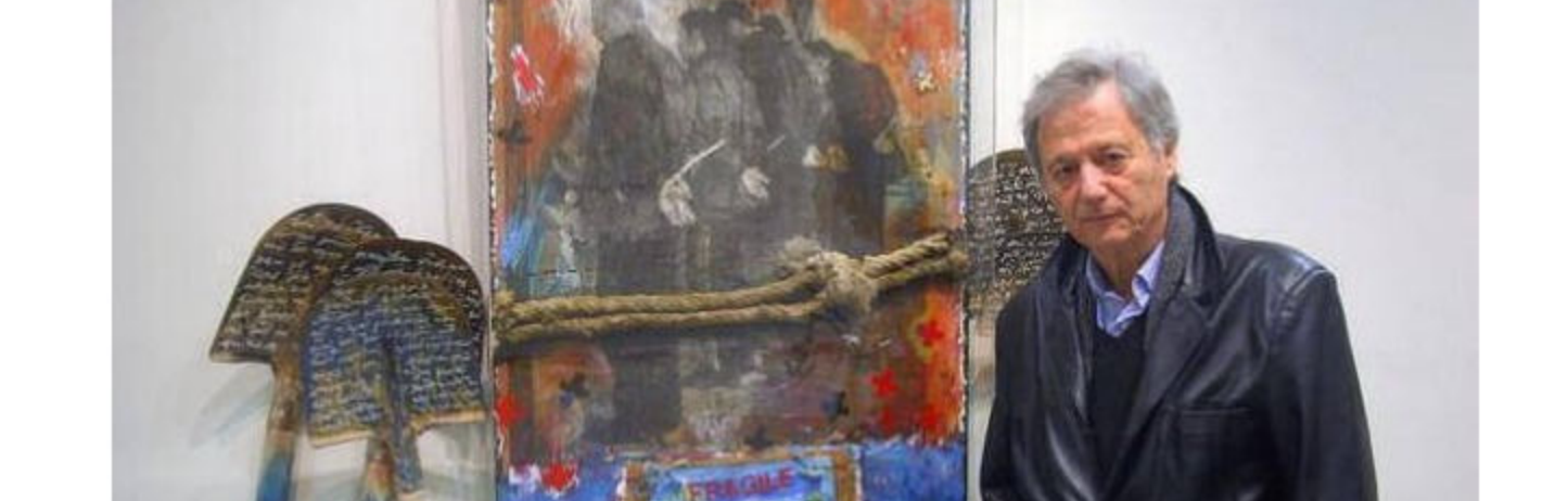
Στο Βερολίνο τη δεκαετία του '70

Όχι απαραίτητα. Εγώ πιστεύω σε μια διαρκή κατάσταση έμπνευσης. Σε μια διαρκή εγρήγορση, οικειότητα με το υλικό. Κάθε στιγμή είναι δυναμεία ικανή να παράξει πνευματικό έργο.