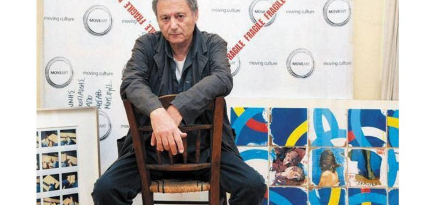
Το πορτρέτο του Γιαννούλη Χαλεπά

Για τον ίδιο λόγο που μιλάμε για πατριαρχία και εννοούμε τη μητριαρχία. Έχουμε ένα πολιτισμό που αν τον ψάξεις βαθιά ως ιστορία και πορεία, θα δεις πόσο ταυτισμένος με τη γλώσσα. Η γλώσσα είναι αποκλειστικότητα εργαλείο.